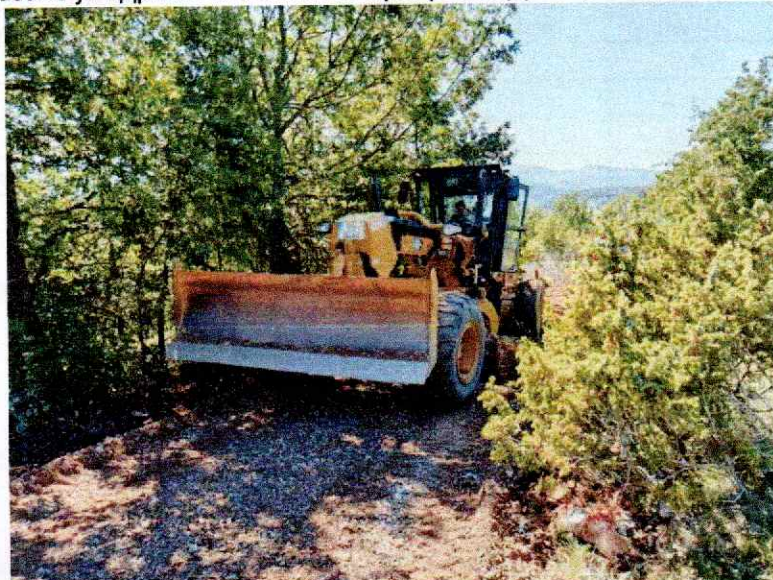
Слика 1. Одржавање локалног пута

На слици 1. Приказано је одржавње локалног пута у оквиру текућег одржавања путева