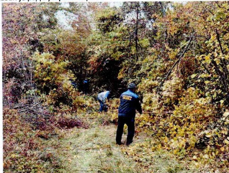
Слика 3. Путарска служба

На слици 3. Приказан је рад путарске службе.