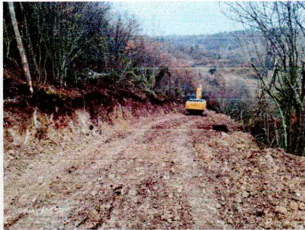
Слика 5. Пробој пута

У табели 8. дат је преглед рада дробилице за камен по мјесецима.