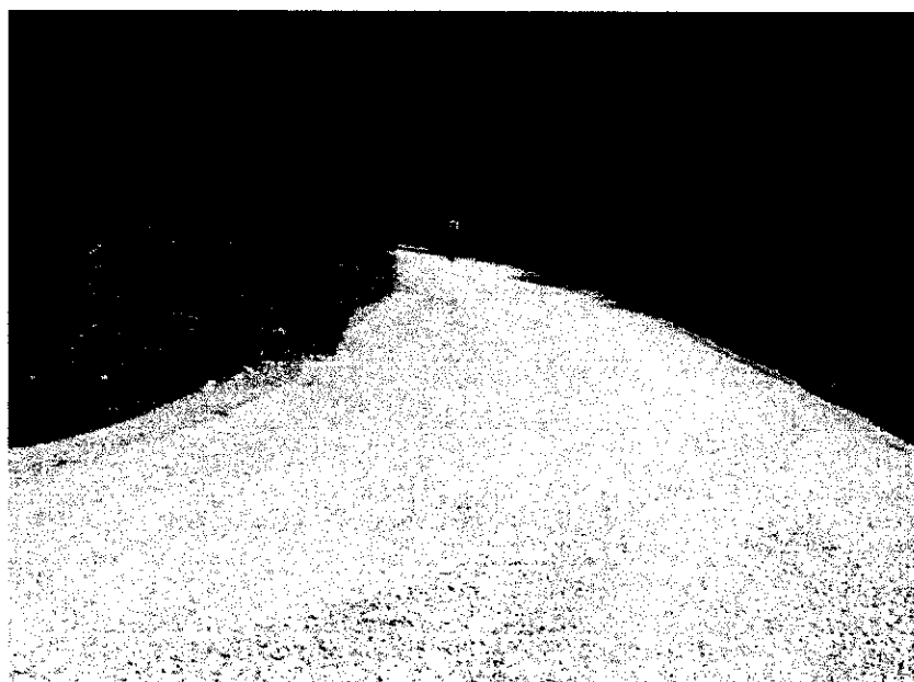
Слика 4. Припремљен пут за асфалтирање

На слици 4. приказан је пут припремљен за асфалтирање.