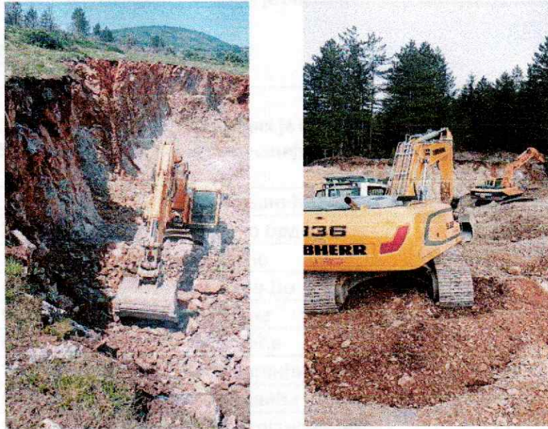
Слика 6. Припрема материјала за мљењење у позајмишту

У табели 10. дат је преглед утрошка горива за претходне радове.